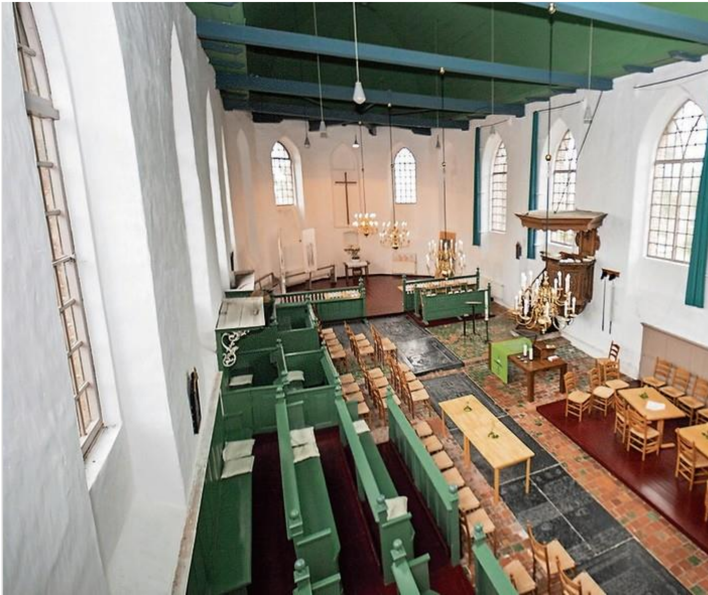
Het interieur van de hervormde kerk van Blijde met in het midden een rij liggende grafzerken.