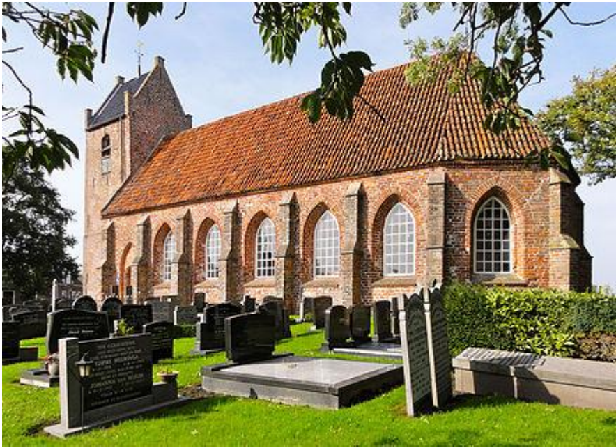
Tsjerke te Eastrum